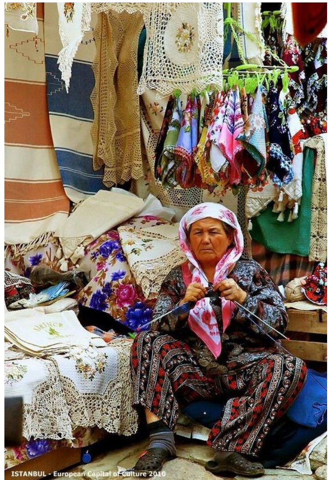
ISTANBUL - European Capital of Culture 2010

Mi objetivo es que hagamos un recorrido mucho más sensible que intelectual a lo largo de estas técnicas artesanales. Que empecemos a desglosar este Universo, conformado de historias, pequeños detalles, secretos, que puedan despejar lagunas de conocimientos y hagan la diferencia en el resultado final de tus proyectos.