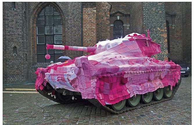
Intervención callejera "Yarn Bombing"

Es increíble pensar como con un solo ovillo de hilado, una aguja de aproximadamente 15cm, y aprendiendo un par de puntos básicos, la técnica nos abre las puertas a infinitos Universos, todo depende de nuestra creatividad.